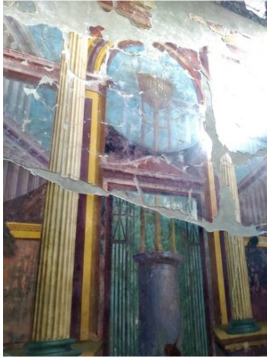
Fresque du salon (oecus) : le trépied de Delphes