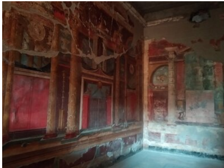
Fresque du triclinium (salle à manger)

Jeudi était un grand jour, attendu des professeurs comme des élèves, puisqu'il nous était donné de voir le magnifique site de Pompéi, dont nous avons découvert une partie l'après-midi durant une visite guidée très instructive faite par notre formidable guide Angelo. Dès l'entrée sur le site, nous avons pu observer quelques moulages des corps saisis dans leurs derniers instants, poignants témoignages de l'éruption du Vésuve en 79 ap. J.-C.