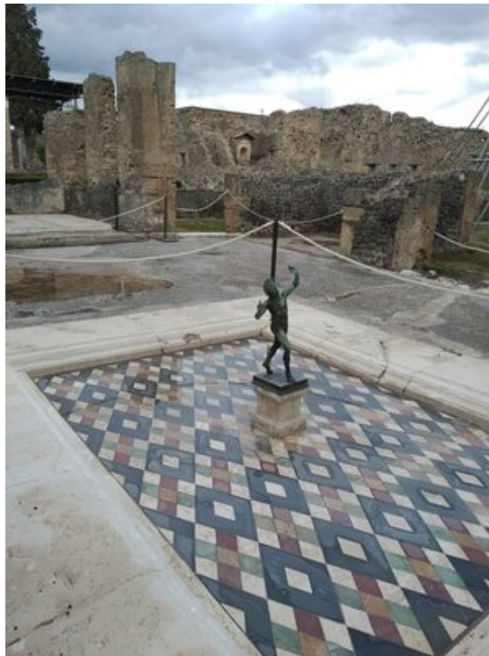
Compluvium de la maison du Faune