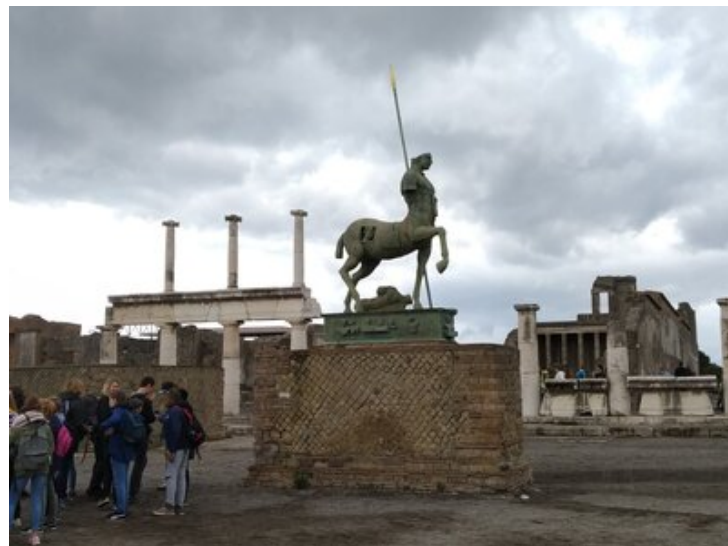
Forum, statue de Centaure