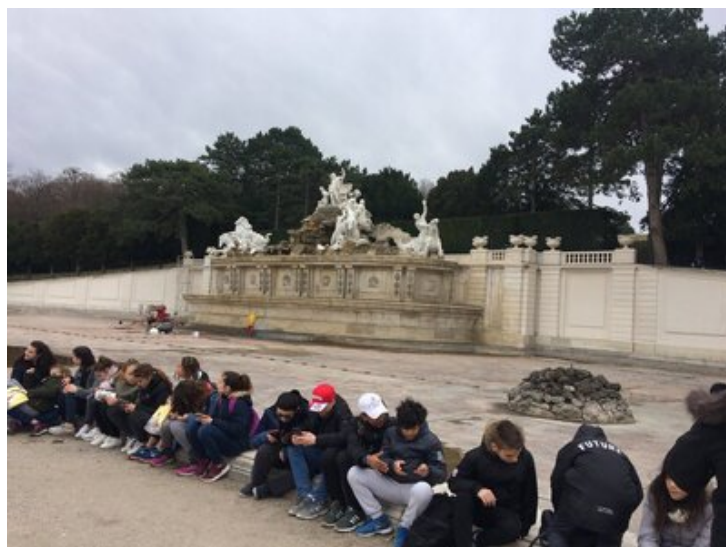
Fontaine de Neptune (1780)