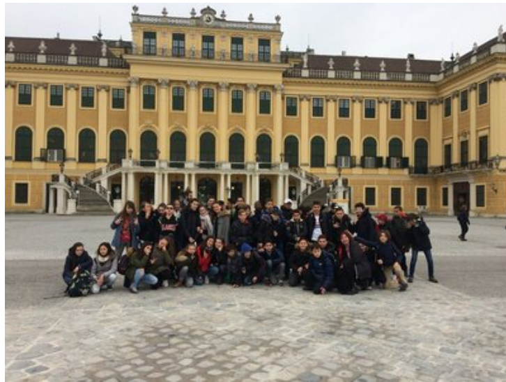
... les professeurs