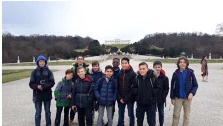
Vue depuis la Gloriette